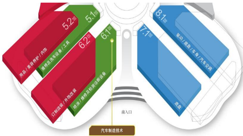
2016AMS汽车制造技术展区 图

◆ 塑料加工设备及模具技术: 注塑机、挤出机、吹塑机、聚氨酯发泡设备、热成型机、模压机、RTM 设备、塑料焊接设备、表面处理设备、机械手、热流道等